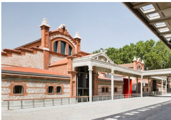
Casa del lector – Espacio Nube